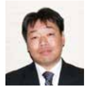
54期社会貢献委員長